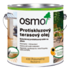
Protiskuzový terasový olej