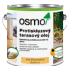
Protiskluzový terasový olej