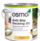
Protiskuzový terasový olej