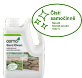
Gard Clean - Odstraňovač zeleného povlaku

Používejte biocidy bezpečným způsobem. Před použitím si vždy přečtěte označení a informace o přípravku.