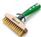
Kartáč k čištění teras s držákem